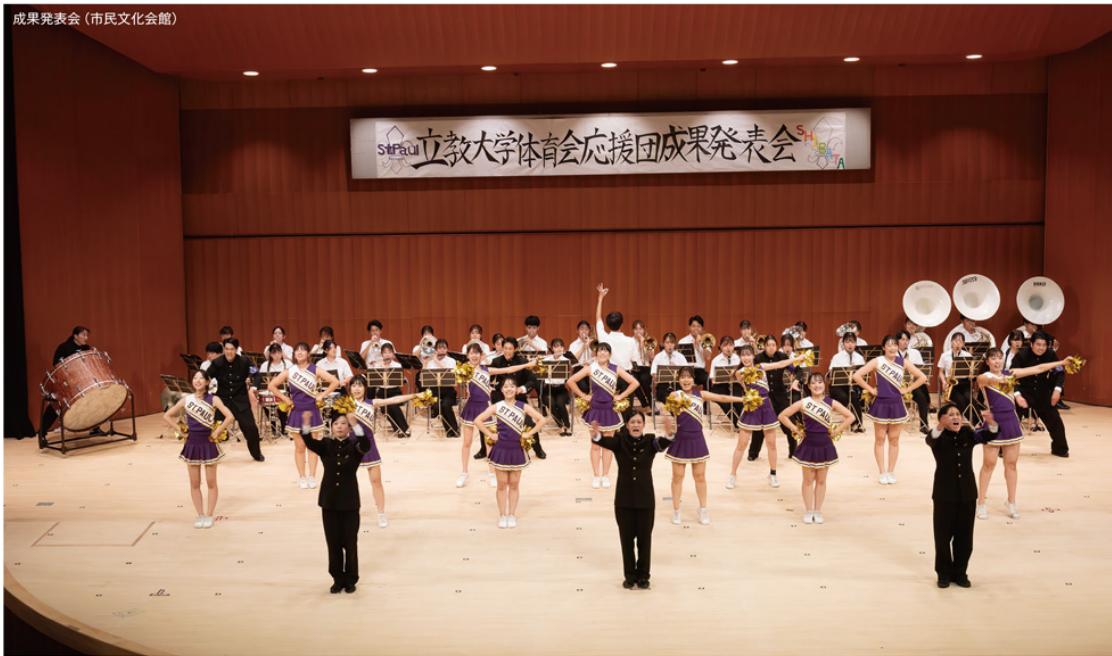
成果発表会 (市民文化会館)