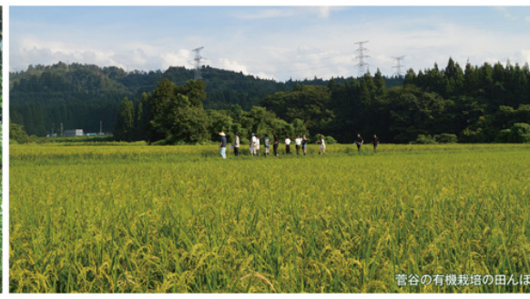
菅谷の有機栽培の田んぼ

は30%程度かな。最も早いスピードで発酵するように、しかも温度が上がるので発火しないように細心の注意を払っています」などと答えていた。年に何回堆肥が作れるかは効率性の観点から非常に重要になる。おそらく新発田はその最先端をいっけて、同じ施設で作れる回数を増やすことができれば入れられる畜糞はその分増える。当然作った堆肥を使ってもらう工夫も必要、試行錯誤を繰り返しながら新発田の堆肥作りは結果的に高い水準に達した。稲作・畜産の両方が盛んなので堆肥作りは「食の循環を進める上で欠かせない。」