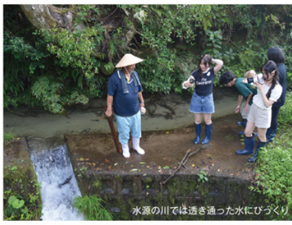
水源の川では透き通った水にびづくり

「発酵させるとときに最適な酸素の含有量は、かなり専門的な質問が高校生から飛んで来た加治川有機資源センター。説明役の森所長は発酵段階で違ってくるけど、最後