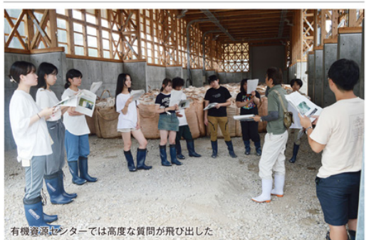
有機資源センターでは高度な質問が飛び出した

手上げ方式で参加した女子のうち3人は 昨年も参加したという、うち3人は「毎日、新発田産のコシヒカリを食べています。ほかのお米は食べられません」と言い、もうひとり「水が冷たくてキレイだし、虫がいないのも有機だから。おいしいと品質は比例するんですけど納得。引率の先生は「実はお酒も去年から新発田のなんです」と笑っていた。