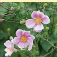
今年も咲いた秋明菊