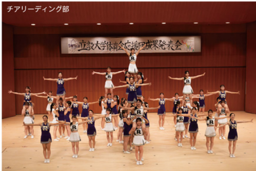
チアリーディング部