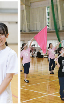
カラーガードの練習