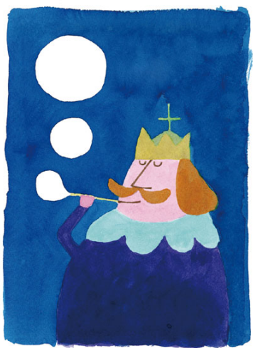
「ぼくは王さま」(文・寺村舞夫)表紙 1967 理論社 多摩美術大学アートアカイセンター蔵 ©Wada Makoto