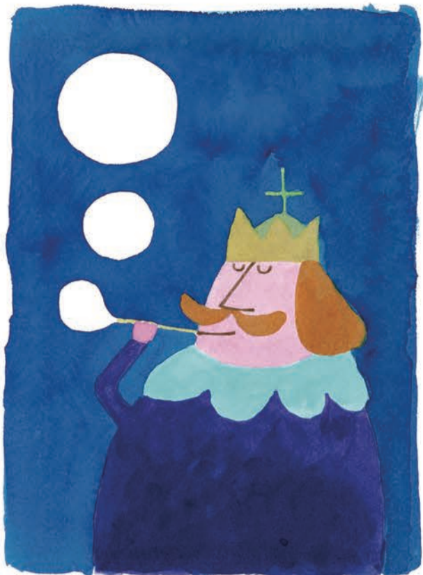
『ぼくは王さま』(文・寺村輝夫)表紙 1967 理論社 多摩美術大学アートアーカイブセンター蔵 ©Wada Makoto

☆ 和田誠の仕事のうち、約2千800点が今回、展覧される。「児童書のイラストレーション」の温かみ、「谷川俊太郎との絵本」の情緒、「似顔絵」のユーモア、見どころは多い。何度でも通いたい展覧会だ。