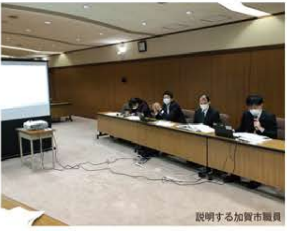
説明する加賀市職員

そこで加賀市では平成28(2016)年、先進技術導入とそれを支える人材育成を新たな成長戦略の二本柱とした。民間に仕事があれば人口維持も出来ないし、市税確保