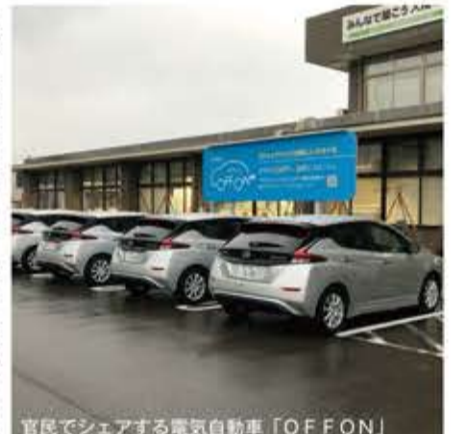
官民でシェアする電気自動車「OFFON」

が、加賀市では令和3(2021)年10月末現在、申請率が約80%に達している。この取組は感染症禍で「パンデミックに対する耐性