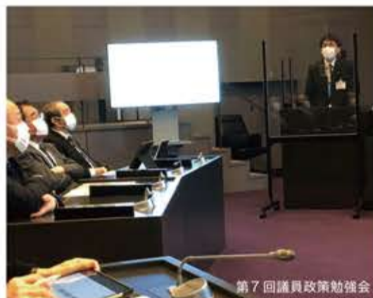
第7回議員政策勉強会

感染症禍の中であるからこそ、ポストコロナを見据えた企画の計画・実施は貴重である。単に観光面だけではない、例えば技能実習生の存在なくして人手不足は解決できないばかりか、留学生の受け入れなどによる相互のウェルネス醸成と将来的な日本と地域発展のためには国際化が必須である。ただ、多文化共生だけでなく、可能な部分での同質化も併せて進めなければならぬ。