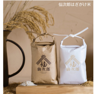
仙次郎はさかけ米

また、10月18日(月)・20日(水)に東京ビッグサイトで開催された「TFFTインテリアイフスタイルビング」にも出展した。このイベントはインテリアやテキスタイルなどのメーカー約300社が出展