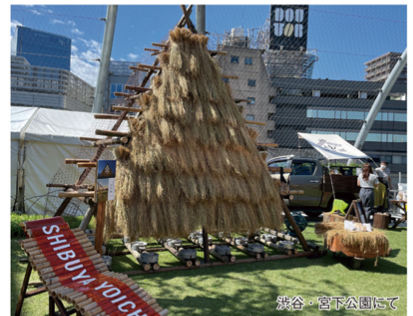
渋谷・宮下公園にて

従って、稲架に稲が架かっているとき、ハロウィンや七夕など季節ごとに表情を変えざるを得ないのである。