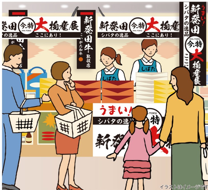
イラストはイマイシゲ

販売店は10月23日(土)現在で、イオン新発田店、ウオロク緑店・コモ店・住吉店・東新町店、原信西新発田店、かんだストア・マルゲンスーパー大栄町店、スーパーいまがわ川東店・紫雲寺店、その他寺町たまり駅産直市場のこたたまや・わんわんファーム新発田店・月岡店、とんとん市場新発田店など15カ所である。参加事業者と販売店は現在も募集中で、実施時にはもう少し増える可能性がある。