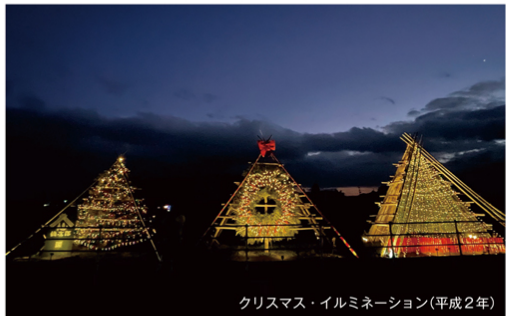
クリスマス・イルミネーション(平成2年)

キーワードは「はさかけ農家」。「手間をかけることを愉しむ」「魅せる農家」伝統農法を復活させるだけでなく、若い新しい感覚(デザイン)を加えつつ、今までの街の景色を見せるものに挑戦していった。