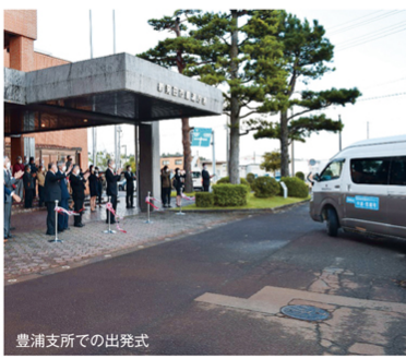
豊浦支所での出発式

豊浦地域の公共交通の2経路の乗り合い小型自動車の出発式が、10月20日(水)午前6時45分から行われた。 その1つ「中浦・荒橋号」の第1便は大沢を7時35分の始発で、岡屋敷を經由、加治万代・吉浦などを通って、朝日ヶ丘団地から大伝・赤橋・小坂から下荒町、そして農業高校前を通って新発田駅、最終的に新発田営業所に至る。通学・通勤の利用を想定した便であり、新発田駅からあやめバスやJRに接続する。第2便の出発は9時25分であり、買い物等を想定した便であり、イオンモールを經由し、西新発田駅に至り、そこからあやめバスやJRに接続する。午後は逆コースとなり、時刻表を確認後に利用する便・乗降する停留所を電話で予約(1・2便は前日18時まで、3便は当日12時まで、4便は当日15時まで)0254・22-4714(株)下越タクシー(9時~18時)するものだ。こちらは公共交通古域だったため、将来的な道路緑化を見据え、完全マインド予約方式からスタートする。