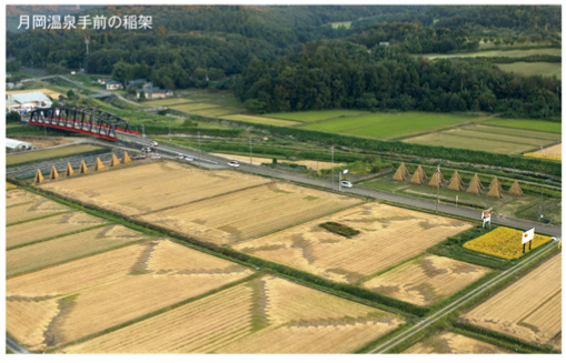
月岡温泉手前の稲架