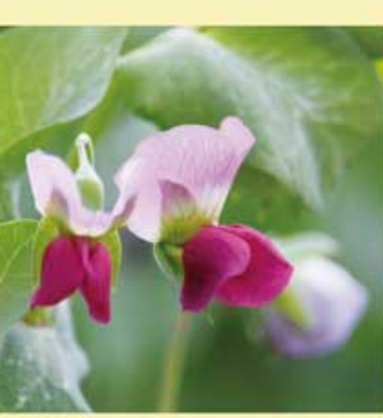
サイエントウの花

▼堀部安兵衛の縁で墨田区との交流が続いている。先方から、かつての新発田藩下屋敷跡地に建つ中和小学校の「秋フェスティバル」で新発田の物産販売を頼まれた。来年は新発田の安兵衛ゆかりの地を回りたいそうだが300年も前の赤穂浪士の史実が人形浄瑠璃「仮名手本忠臣蔵」となり、歌舞伎に移されて評判を呼び、江戸時代後期からは浪曲・講談の題材として、安兵衛の気持は不動のものとなった。芸術・文化のちからは大きい▼歌舞伎といえば「近江源氏先人館」(通称・盛綱陣屋)も時代物の名作だ。鎌倉時代、源頼家・実朝兄弟が敵対して戦ったのに従って、佐々木盛綱・高綱兄弟も敵味方に分かれて戦う。主君への忠か兄弟愛かの板挟みで…との物語で、中村吉右衛門の当たり役だ▼史実はもちろん物語とは異なる。兄弟はともに源頼朝に従った。盛綱は源平合戦・藤戸の戦いで先陣を切って平家に勝利した武将だ。「平家物語」で語られ、謡曲「藤戸」になった。盛綱はのちに越後加地荘の地頭となり、その子孫たちが近隣を治めた。加地城や藤戸神社はその遺跡だ▼岡山県倉敷にはいわば本家というべき藤戸神社があるが、先日「藤戸合戦保存振興会」の一行5人が新発田市を訪れ、それに先立って新発田市からも倉敷を訪問した。ここでも、歴史と歌舞伎を仲立ちとした交流が始まった。