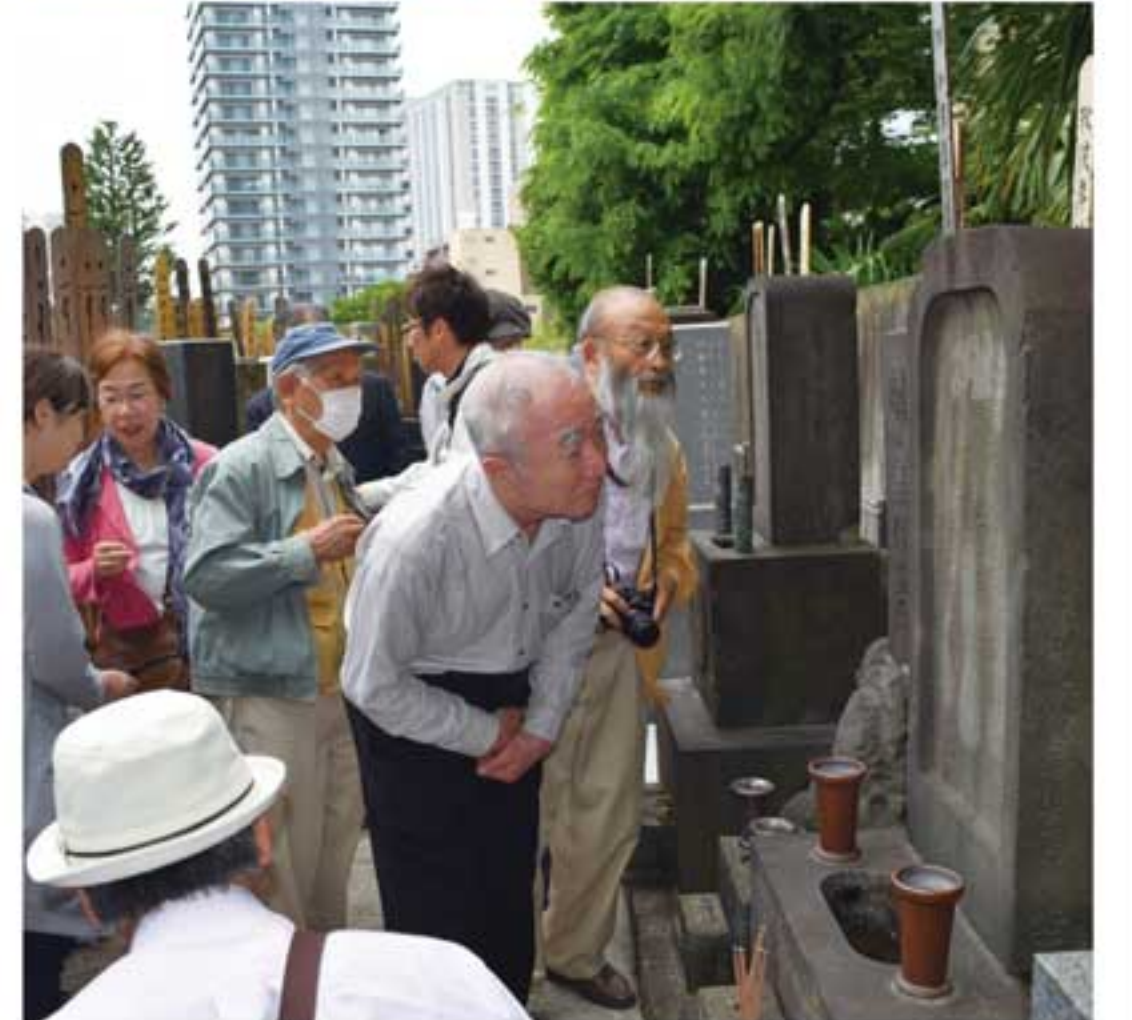
堀部家の菩提寺・青松寺に参詣

討入を成就させたのは、当事の「喧嘩両成敗のルールを踏み外した浅野切腹、吉良おかまいなし」の裁定に対する武家・町人らの不満解消のための措置だ。