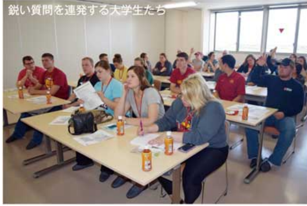
世界水準の衛生管理システムに驚きを隠せない