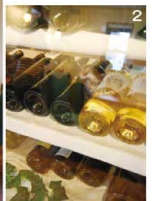
1. 洋風だが和皿とお箸がよく似合う店内。ディナーメニューは単品378円(税込)から。おすすめは「鶏と長芋の赤ワイン煮のクロケット」(3個 702円税込)。珍しい長芋のクロケットは是非! 2. ワインや地元新発田の日本酒もご用意