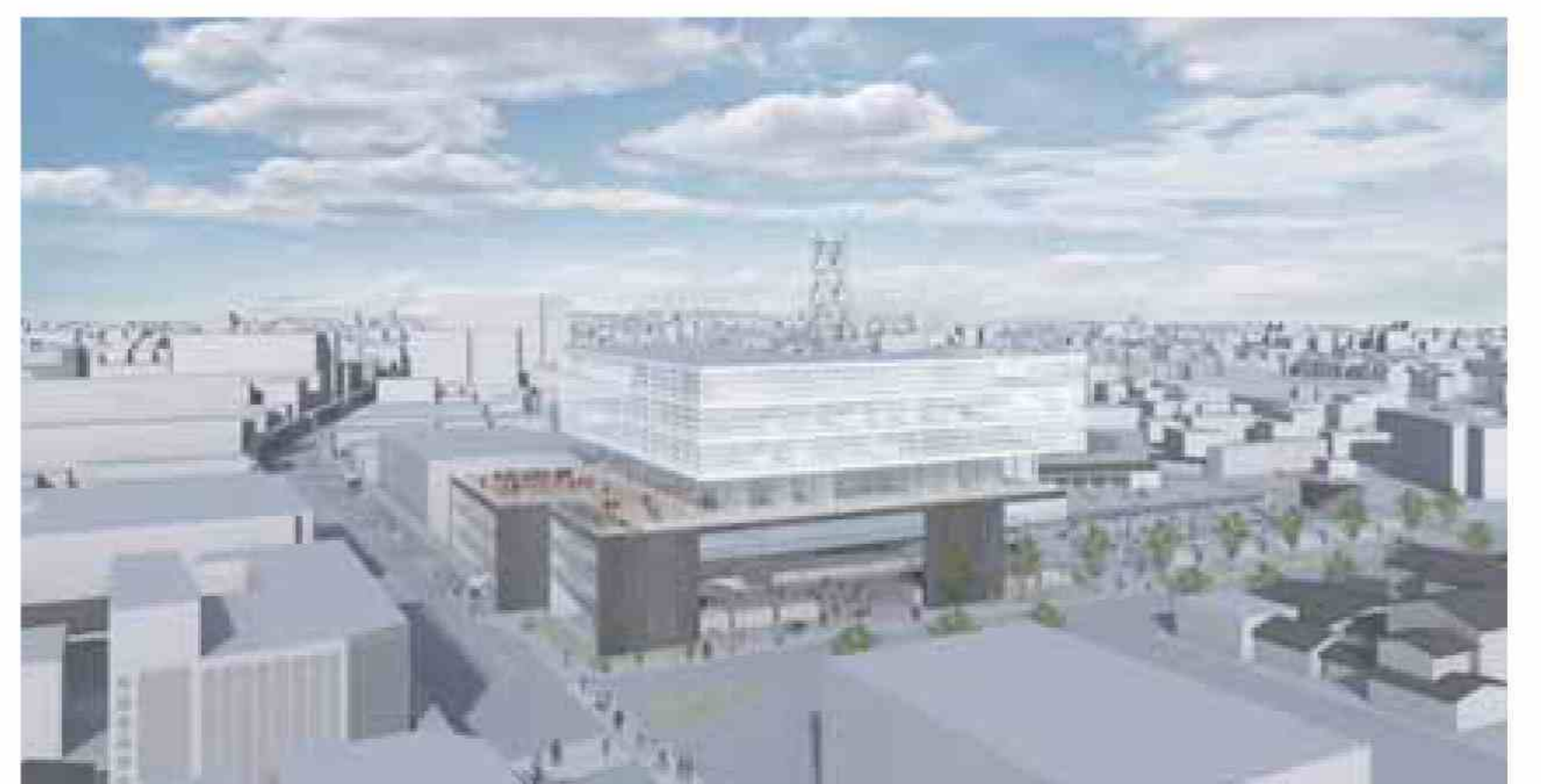
街との親和性を重視。道路に面する建物入口部分は分節し、上層階は道路から奥へ離している