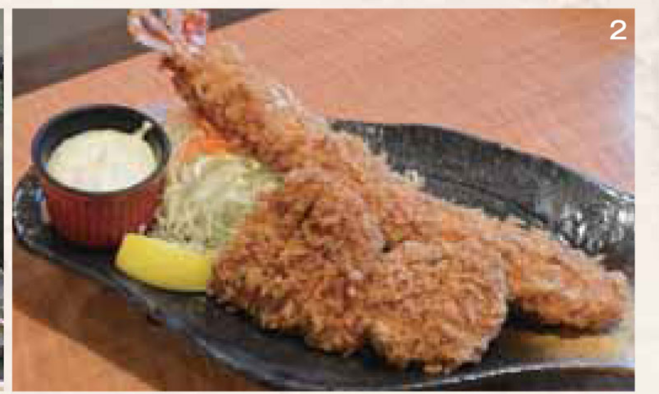
1. 小気味良く作業する澁谷哲郎店長。2. 長さ25cm超の超ジャンボ海老フライはもちろん天然、ぶりぶりの食感で見た目、味ともに楽しませてくれる。超ジャンボ海老フライとひれ・ロースのデラックス膳はごはん・みそ汁・漬物付きで2,180円(税別) 3. 落ち着いた店内。テイクアウトにも対応してくれるからうれしい