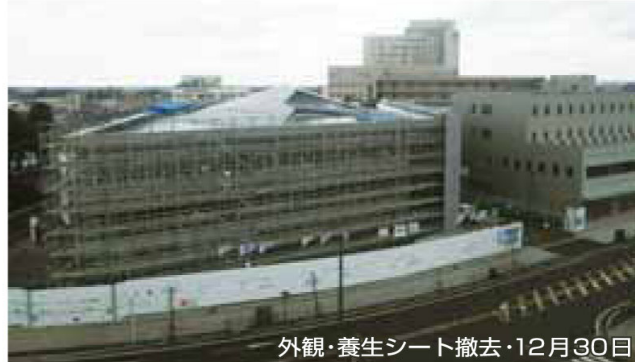
外観・養生シート撤去・12月30日