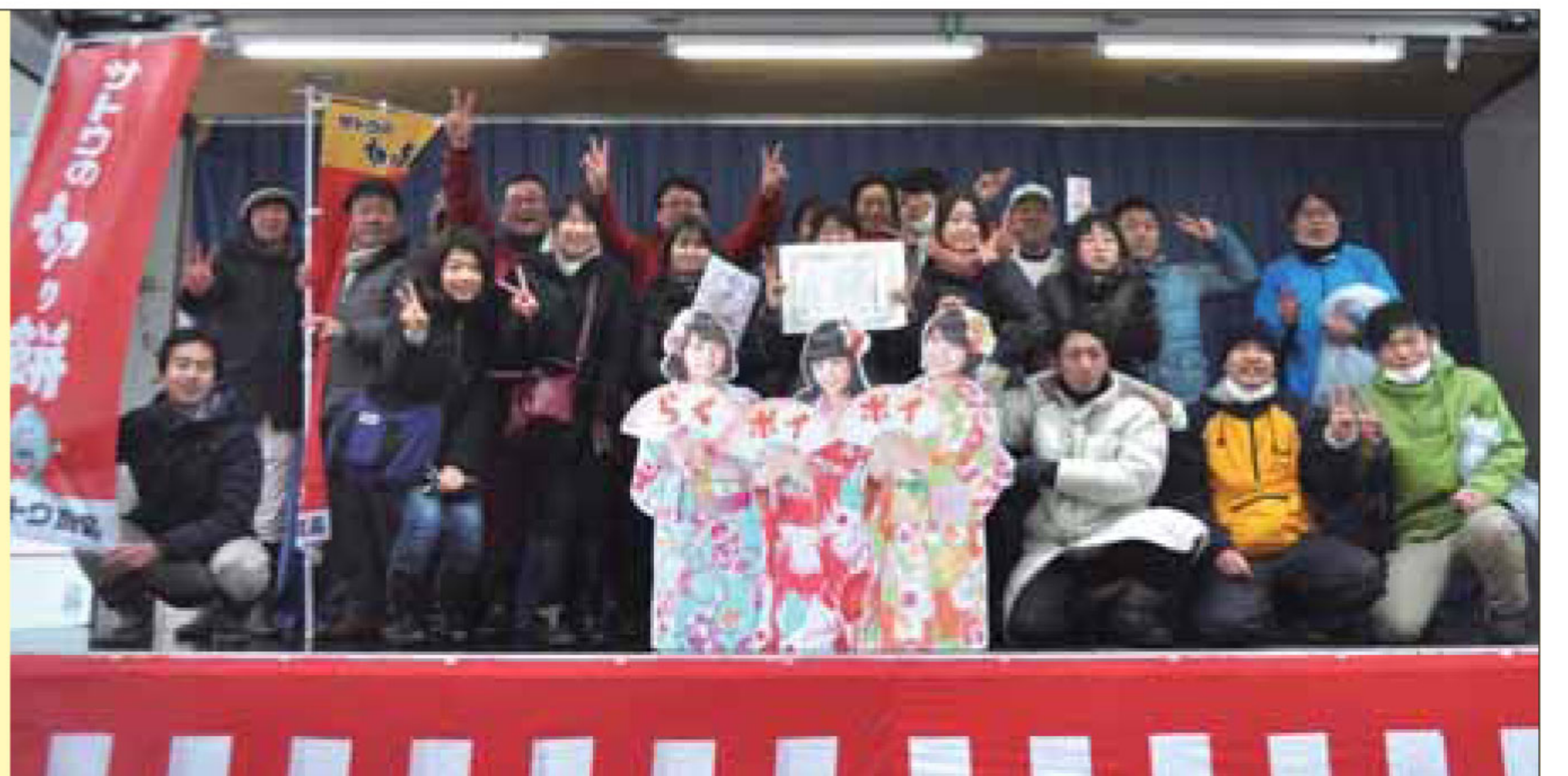
結果発表後の特設ステージで記念写真を撮るサトウの切り餅新発田工場の方々。Negiccoは今年もパネルで登場