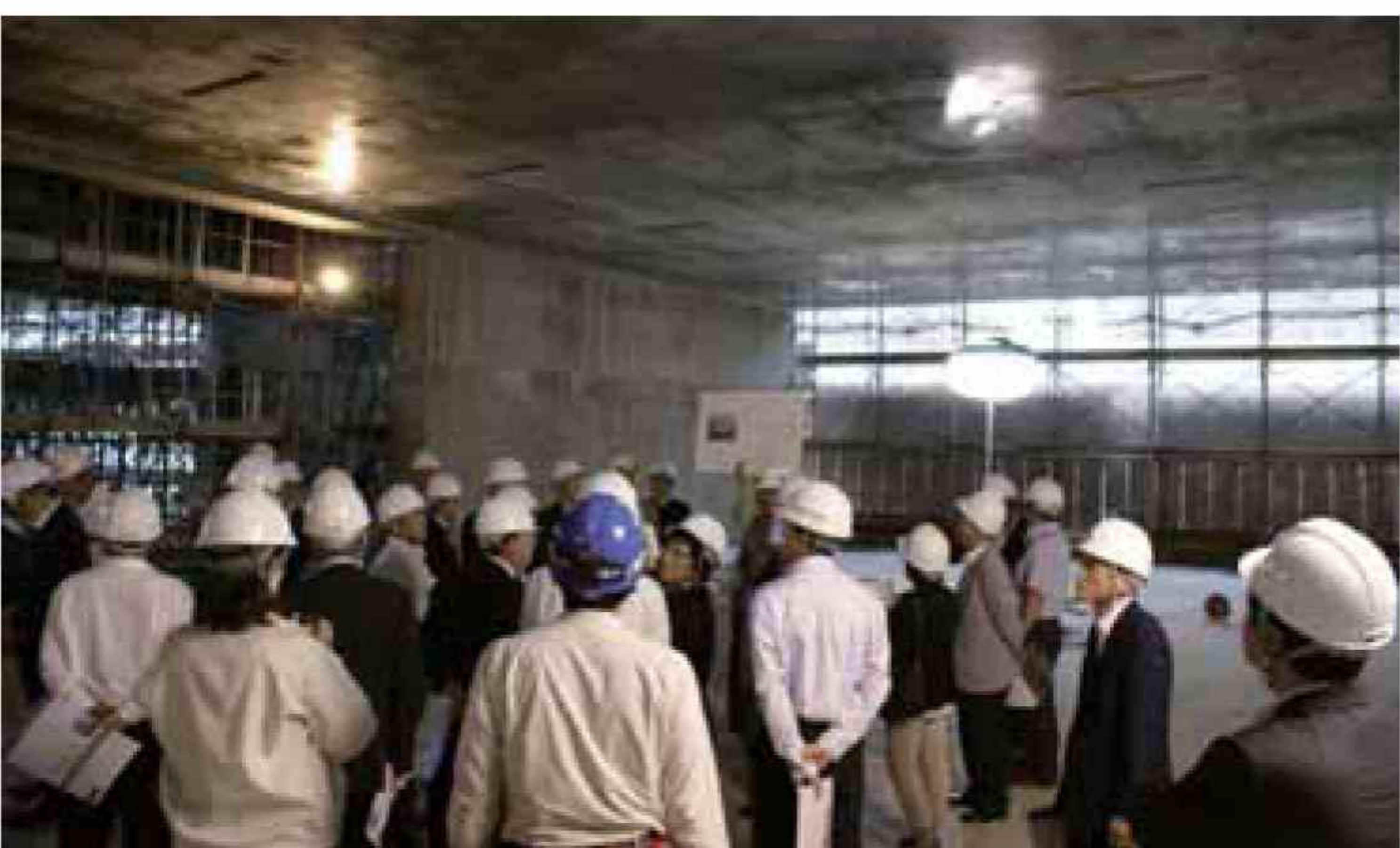
1~3階までは壁と床版(壁柱構造)で構成されるため、内部は広々としている