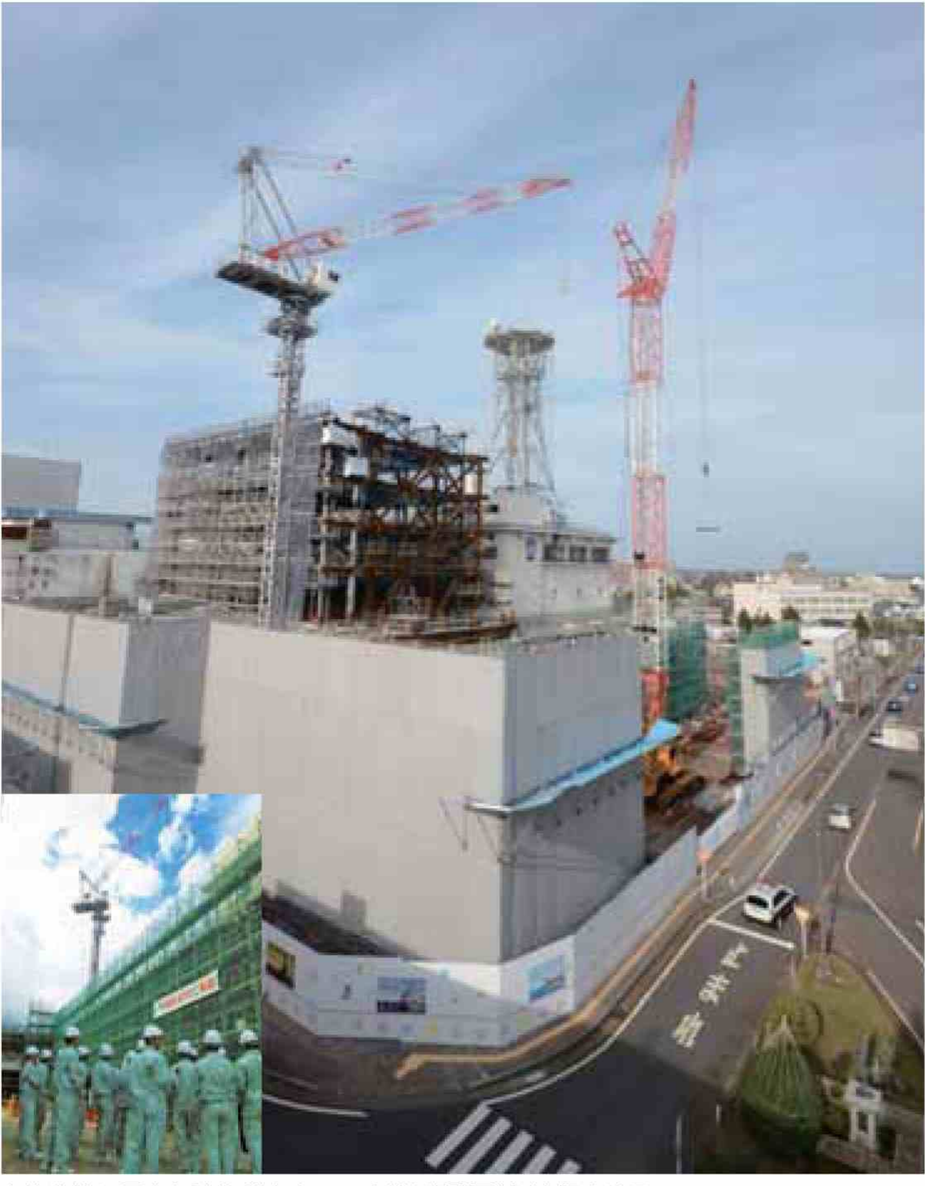
次第次第に巨大な建物が出来ていく様は「発展」を連想させる

問題は運用だ。例として最も優れているのは「富山ランドプラザ」(屋根付き半屋外広場と岩手県の「オガール」(図書館・子育て支援施設・体育館・商業施設の複合施設)だ。こちらも年間100万人以上が利用