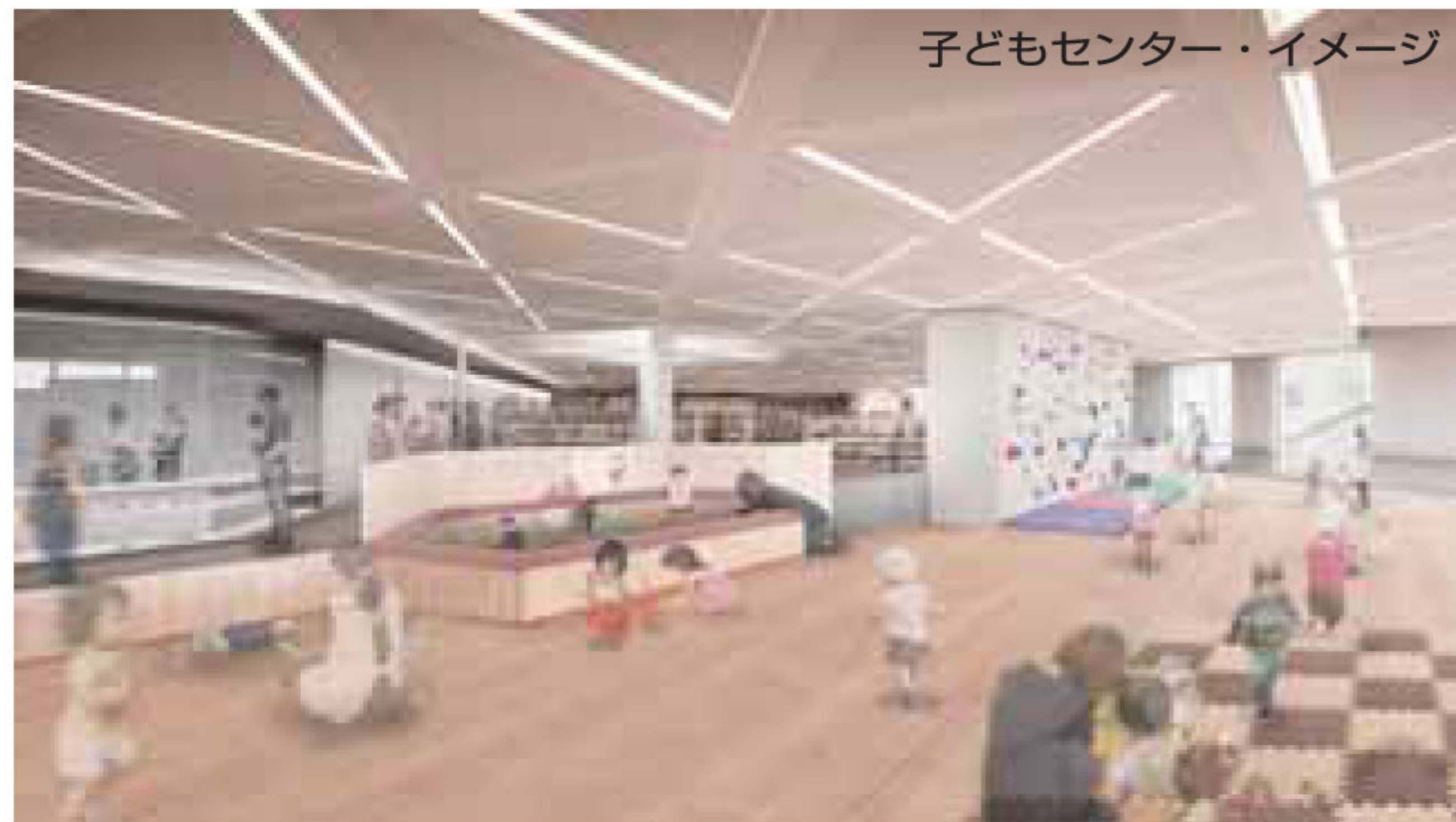
子どもセンター・イメージ