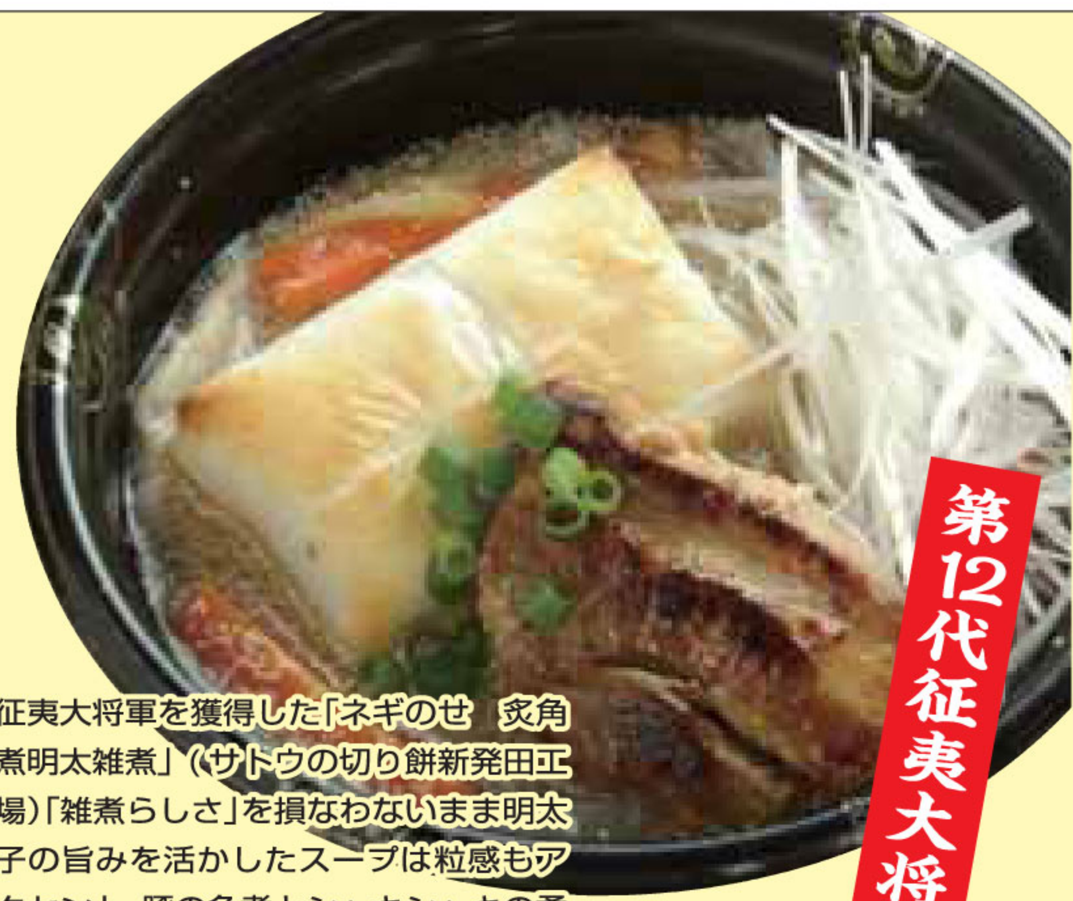
征夷大将軍を獲得した「ネギのせ 炙角煮明太雑煮」(サトウの切り餅新発田工場)「雑煮らしさ」を損なわないまま明太子の旨みを活かしたスープは粒感もアクセント。豚の角煮とシャキシャキの柔肌ネギが食べる楽しさを盛り上げる