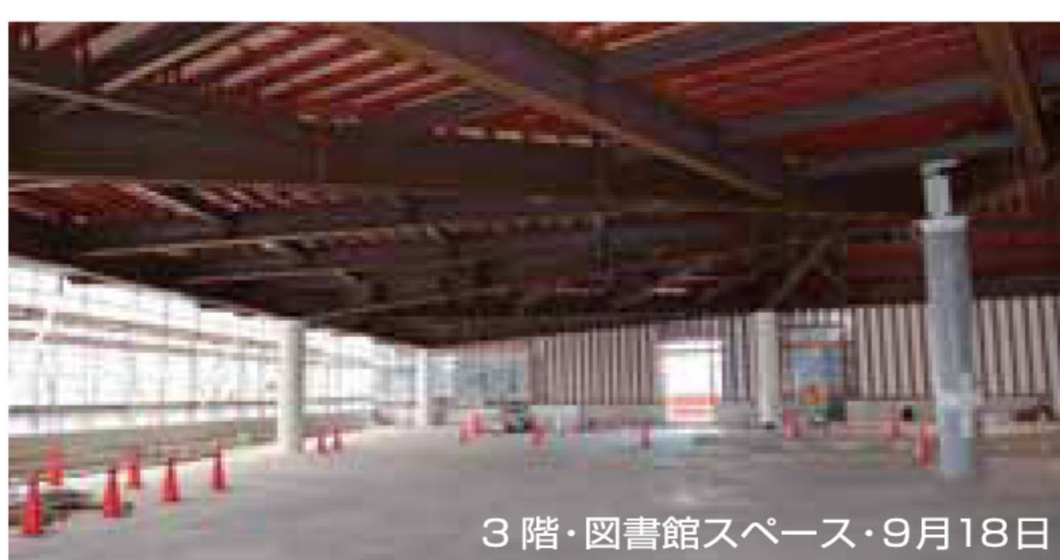
3階・図書館スペース・9月18日

実施設計時で工事費ベースで約35億円、事業費ベースで約39億円が投じられて建設される複合施設である。図書館や子どもセンターのそれぞれの機能を超えて、「にぎわい創出」「市民交流」を目指している。限りにおいて、どのように利用し、運営するかによって、施設の成否が問われることになる。