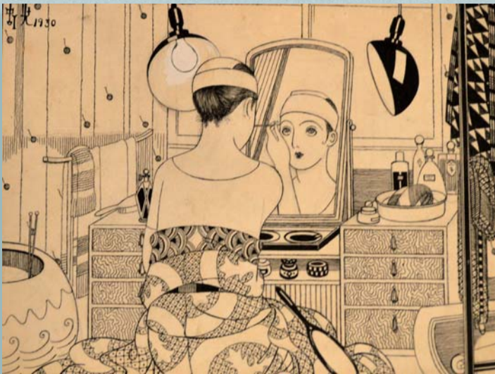
『花嫁人形』より 落谷虹児詩画集

誰が踊るべき 正しき芸道の険しさを 踏み外したる踊り子の 白粉あつく紅つよく からくも涙をかくしたり。 その名を人に讃はれて 身に錦繡をまとへども 哀しき女にあらずして 誰が！強ひられて踊るべき。