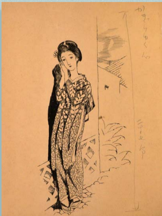
※夢二の作品は毛筆彩色画が多い。 ペンによる線描画は主流ではなく、その意味でも貴重な作品である。

誰が踊るべき 正しき芸道の険しさを 踏み外したる踊り子の 白粉あつく紅つよく からくも涙をかくしたり。 その名を人に讃はれて 身に錦繡をまとへども 哀しき女にあらずして 誰が！強ひられて踊るべき。