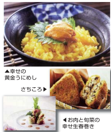
▲幸せの黄金うにめし さちめし ▼お肉と旬菜の幸せ生春巻き