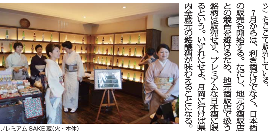
プレミアムSAKE蔵(火・木休)

7月からは、利き酒だけでなく、日本酒の販売も開始する。ただし、地元の酒販店との競合を避けるため、地元酒販店で扱う銘柄は販売せず、プレミアムな日本酒に限るといふ。いずれにせよ、月岡に行けば県内全蔵元の銘醸酒が味わえることになる。