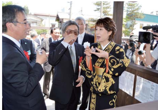
手湯の杜で温泉を試飲

第一に、初めて温泉が湧出した場所に新パワースポット「手湯の杜」を整備し、飲泉とした。ご存じ、エメラルドグリーンで硫黄分の強い温泉(温泉分析書・含硫黄ナトリウム・塩化物泉)は硫黄成分による美肌作用、塩化物成分による保湿作用にすぐれ、「もっと美人になる温泉」として有名だ。これを飲むと整腸作用があり、便秘が解消するという。ただし、飲み過ぎても