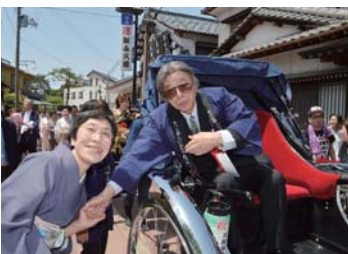
たかたかし、熱烈なファンと握手