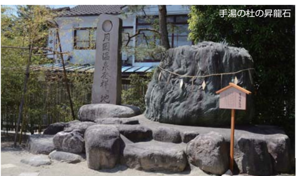
手湯の杜の昇龍石