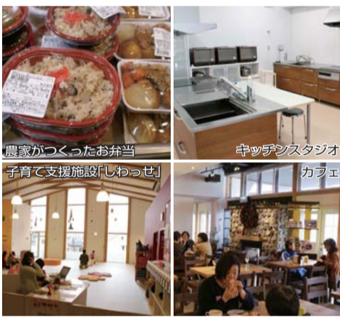
農家がつくったお弁当、キッチンスタジオ、子育て支援施設「しわっせ」、カフェ