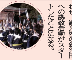
わせ、観光客の新発田への誘致活動がスタートしたことになる。