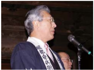
これは再来年の月岡開湯百年に向けてのジャンピン・ボードだ。ぜひとも成功させたい」と語った。

◎義士祭(12月14日・長徳寺) パレード開始の挨拶後「武庸会は来年、百周年を迎える。来年は新発田を安兵衛一色で塗りつぶし、市外・県外から多くの観光客を迎えたい。『忠臣蔵サミット』の誘致も成功したし、ハリウッド映画『47RONIN』も封切の予定だ。安兵衛関連の映画が演劇などもやってみたい。これは再来年の月岡開湯百年に向けてのジャンピン・ボードだ。ぜひとも成功させたい」と語った。