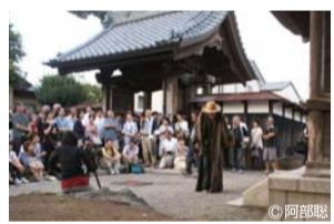
義士堂前は観客であふれた