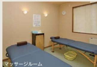
マッサージルーム

「もっと美人になれる月岡温泉」の源泉は、エメラルドグリーン。硫黄臭が特徴の良泉。平日で200人、休日は300人以上も訪れるという人気の共同浴場。無料休憩室や仮眠室もある。希望により午後からはマッサージ(有料)も受けられる。