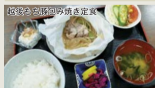
越後もち豚包み焼き定食

お湯は「月岡温泉」と同じ泉質で濃いエメラルドグリーンが美しい。売店・無料休憩室のほか個室の貸切もある。食事メニューが58種と豊富なのがウリ。ここは意外な穴場だ！ 送迎もしている。詳しくは問合せを。