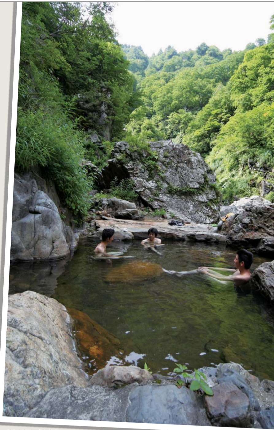
湯の平温泉・露天風呂

谷底まで下りて、深い緑の間を「ゴゴ」と流れる飯豊川沿いの露天風呂（饗湯）に浸れば、蝉しぐれ、時にウグイスのさえずりが聞こえるのみの別天地。6時間かけて来ただけの価値はある。女湯（本湯）は山荘の手前、囲いで三方が囲まれ、脱衣所もある。湯量が豊富なために露天風呂より熱い。こちらも溪流が望める。 10月末頃までは山荘に管理人がいて宿泊・休憩・トイレ（有料）もあり、炊事場も使える。キャンプ場（有料）もあるが、食糧・燃料の販売はしていないので、持参しなければならぬ。今度は寝袋・食糧持参、2日ばかり来てみたい。（問合せ）新発田市観光振興課 0254・22・3101