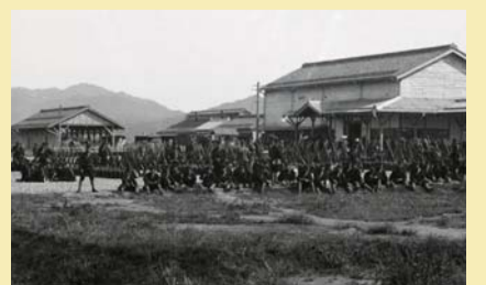
新発田駅に集合した新発田第十六連隊(大正初期)

▼9月2日に羽越本線(新発田～新津間)・新発田駅開業100周年を迎える。100年前は大正元年、その頃は俗に大正デモクラシーと言われる安定期だが、大正12年に関東大震災が起きた。発災4週間後に帝都復興院を創設、後藤新平が総裁となって、100m道路やライフラインの共同溝化など、今から見ても画期的な計画が立案され、素早い対応が評価されている。▼しかし、財政難と一部市民の反対で土地収用が進まず、実現できなかった計画もあった。防災公園や中央分離帯の未整備は東京大空襲時の大規模な火災類焼に、環状道路の整備の遅れは日常的な渋滞を招いた。時には私より公を優先させることが求められた事例だ。▼さて、9月2日、JRでは新発田～新津間でSLを2往復させるほか、記念入場券の発売などを予定している。片道1時間弱、C57に牽引された「ばんえつ物語客車」に乗り、往時を偲ぶ旅もいい(詳しくは「羽越本線開業100周年」で検索を)。▼当日エフェムしばたでは、新発田駅・羽越本線に焦点を当てた生特番の放送(9～11時・13～16時)を予定している。多様なゲスト、斬新な企画が満載、こちらも楽しみだ。