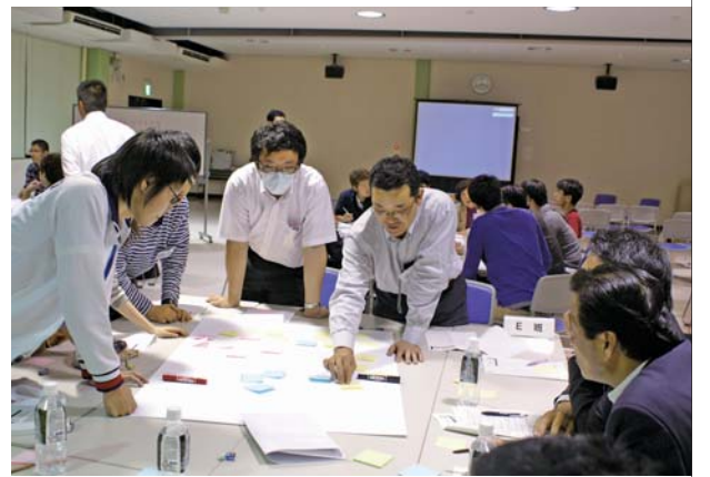
第1回ラウンドテーブルの様子