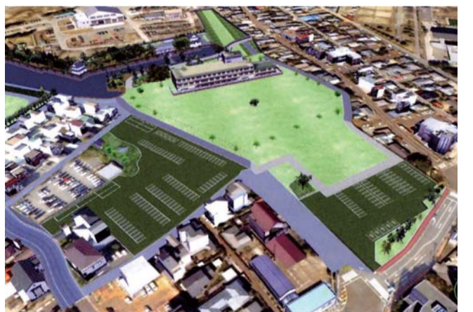
旧県立病院跡地整備のイメージ

市役所新庁舎の整備については「今年度は用地取得と設計の予算を計上させていただきます。県が解体・土壌検査などを終えて引渡されますと、特養ホームを残して広大な更地が出現します。市が行う整備工事は、短期計画では5年というところですが、財源的には合併特例債を活用しますので、27年度末までというのが一応の目安です。ただ、設計の内容によっても影響を受けますから、すべて『整備計画』通りに行えるかどうか、